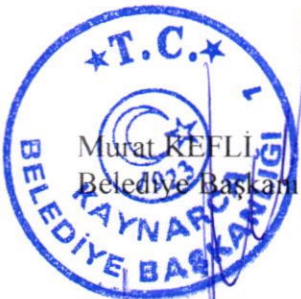
Murat KEFLİ Belediye Başkanı

BAŞKAN : Gündemin Üçüncü Maddesinden de anlaşılacağı üzere; 5393 Sayılı Belediye Kanununun 49'uncu maddesi 3,4 ve 5'inci fıkraları gereği Belediyemiz kadrosunda, norm kadroya uygun olarak teknik, eğitim ve danışmanlık alanlarında boş kadrolara karşılık göstermek suretiyle sözleşmeli personel çalıştırılmaktadır. 5393 Sayılı Kanunun 49'uncu Maddesi Çerçevesinde Bakanlar Kurulunca belirlenecek ücretlere göre tam zamanlı olarak çalışan sözleşmeli personele 2022 yılı için ünvan bazında ekli listede belirtilen net ücretin ve ek ödemenin yapılması, 2022 yılı Temmuz ayında memurlara gelecek zam oranının ücretlerine yansıtılması hususunu oylarınıza sunuyorum. Yapılan oylama neticesinde 2022 yılı içerisinde tam zamanlı sözleşmeli personel çalıştırılması ve ücretlerinin ödenmesi Meclisimizce oy birliği ile kabul edildi.